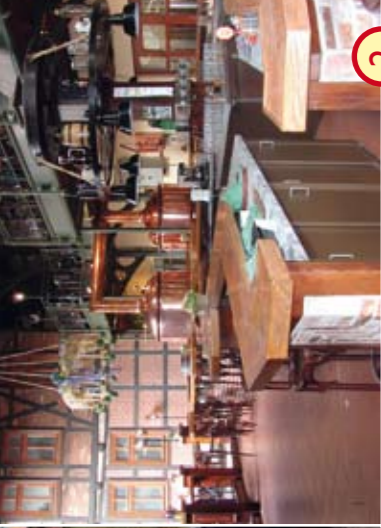
2 Hotel „Zum Brauhaus“ Lüdde