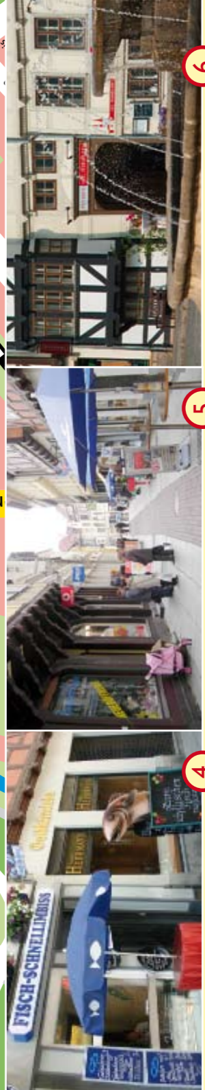
4 Fischrestaurant „Höfler“