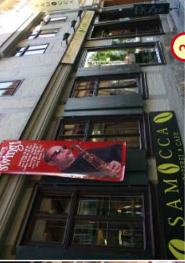
3 Kaffee- und Süßwarencafé „Samocca“